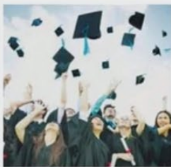
COLAÇÃO DE grau: empregabilidade

> ESPECIALISTAS apontam que o movimento de busca pelo nível técnico caiu com o nível superior mais acessível, já que a educação à distância facilitou o acesso físico e também reduziu custos dos cursos.